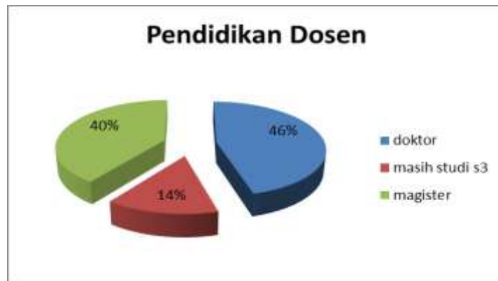
Gambar 3.2 Tingkat Pendidikan Dosen

Profil dosen tetap Program Studi Sarjana Akuntansi, sebagaimana disajikan pada Gambar 3.2, saat ini berjumlah 37 (tiga puluh tujuh), dimana 35 (tiga puluh lima) dosen merupakan dosen tetap Yayasan dan 3 (tiga) dosen merupakan dosen penugasan Kopertis Wilayah 7 Jawa Timur. Dilihat dari kesesuaian bidang program studi sarjana akuntansi ada 35 dosen yang sesuai, sedangkan 2 dosen tidak sesuai, namun mendukung pembelajaran program studi jurusan akuntansi yaitu satu orang di bidang bahasa yang berpendidikan S3 dengan jabatan akademik Lektor Kepala, dan satu orang lagi di bidang hukum yang berpendidikan S2 dengan jabatan akademik asisten ahli. Sebanyak 35 orang dosen dengan bidang keahlian yang sesuai dengan program studi jurusan akuntansi, dilihat berdasarkan tingkat pendidikan sebanyak 46% berpendidikan S3, (16 orang dosen) , sedangkan sisanya bergelar S2 (19 orang dosen). Sehingga keseluruhan dosen berpendidikan S2 dan S3, tidak ada yang berpendidikan S1.